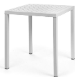
BIANCO vern. bianco 47853.00.000

PT Mesa empilhável 70x70 cm. Material: tampo DurelTOP em polipropileno com tratamento anti-UV colorido na totalidade. Pernas em alumínio pintado. Acabamento fosco. Pés ajustáveis. Resina reciclável.