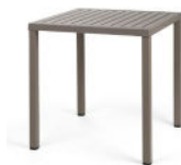
TORTORA vern. tortora 47859.10.000