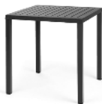
ANTRACITE vern. antracite 47852.02.000