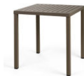
TABACCO vern. tabacco 47867.53.000